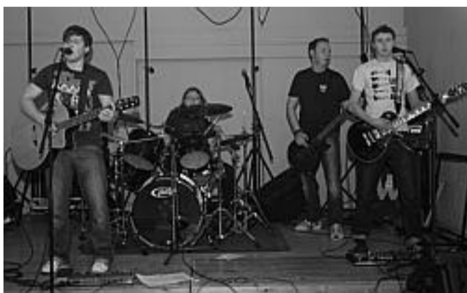
Die Prignitzer Rockband „Beckmaakon“ heizte ein.