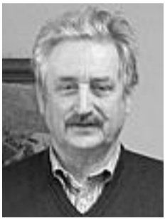
Ludwig Güttler half schon in Dresden.

PUTLITZ | Auch wenn die Witterungsverhältnisse derzeit die größte Hürde für die geplanten Arbeiten an der neuen Putlitzer Kirchturmspitze darstellen: Seit dem 2. Januar existiert schonmal die Baustelle. Pfarrer Volkhart Spitzner teilte dies im Rahmen der Mitgliederversammlung des Fördervereins Kirchturmspitze am Freitagabend im Putlitzer Rathaus mit. Wann es richtig losgeht, sei nur noch vom Wetter abhängig.