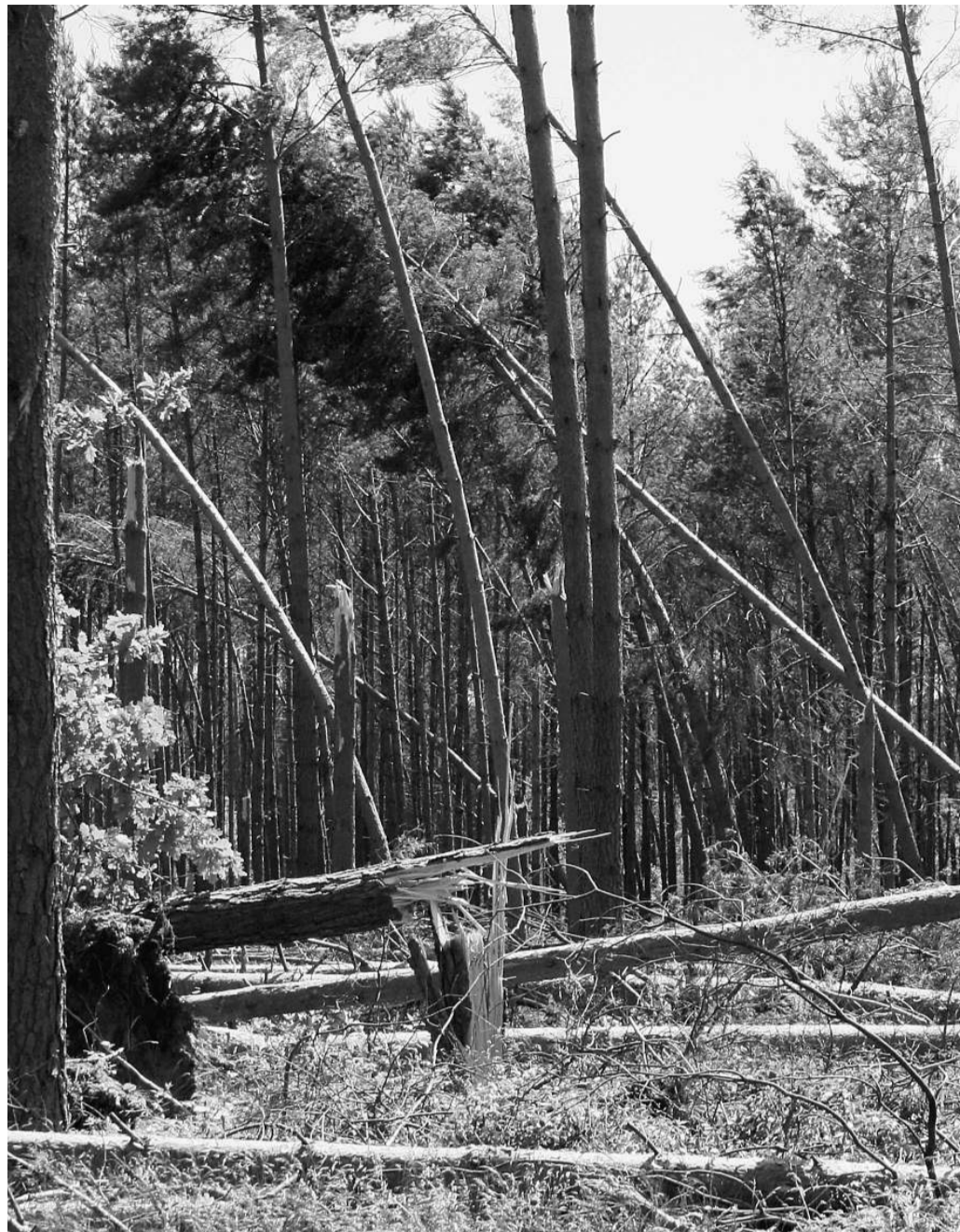
In den Wäldern hinterließ der Tornado ein Bild der Verwüstung.