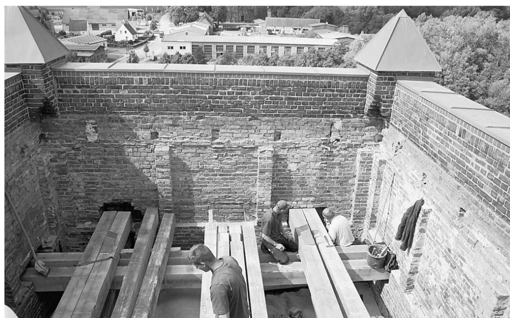
Die Deckenbalkenlage wird eingemauert.

Die Kirchturmuhr, die sich derzeit beim Restaurator befindet, wird erst abschließend eingebaut und dann zu allen vier Himmelsrichtungen wieder die Zeit anzeigen. Die große Stunde der Spitze schlägt schließlich am 3. Oktober. Mit einem Bürgerfest wird die Wiedereinweihung des Kirchturmes begangen. „Die Vorfreude ist groß“, sagt Pfarrer Spitzner.